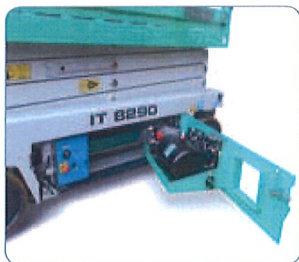
Montaggio dei componenti razionale e di facile manutenzione.