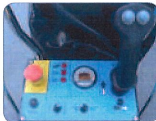
Quadro comandi sulla piattaforma semplice e intuitivo