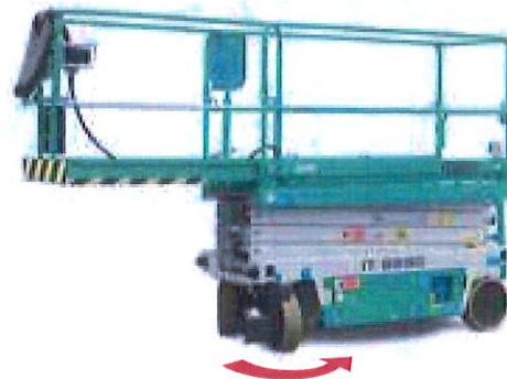
Estensione manuale piattaforma 1,4 m