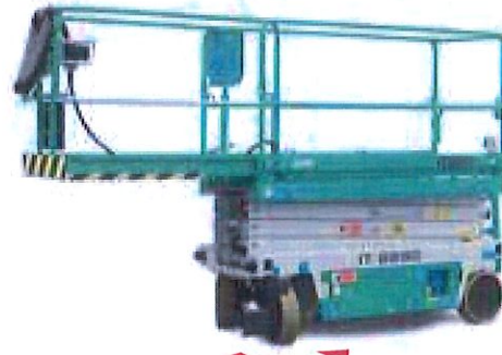
Estensione manuale piattaforma 1,4 m