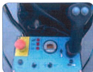
Quadro comandi sulla piattaforma semplice e intuitivo