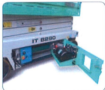
Montaggio dei componenti razionale e di facile manutenzione.